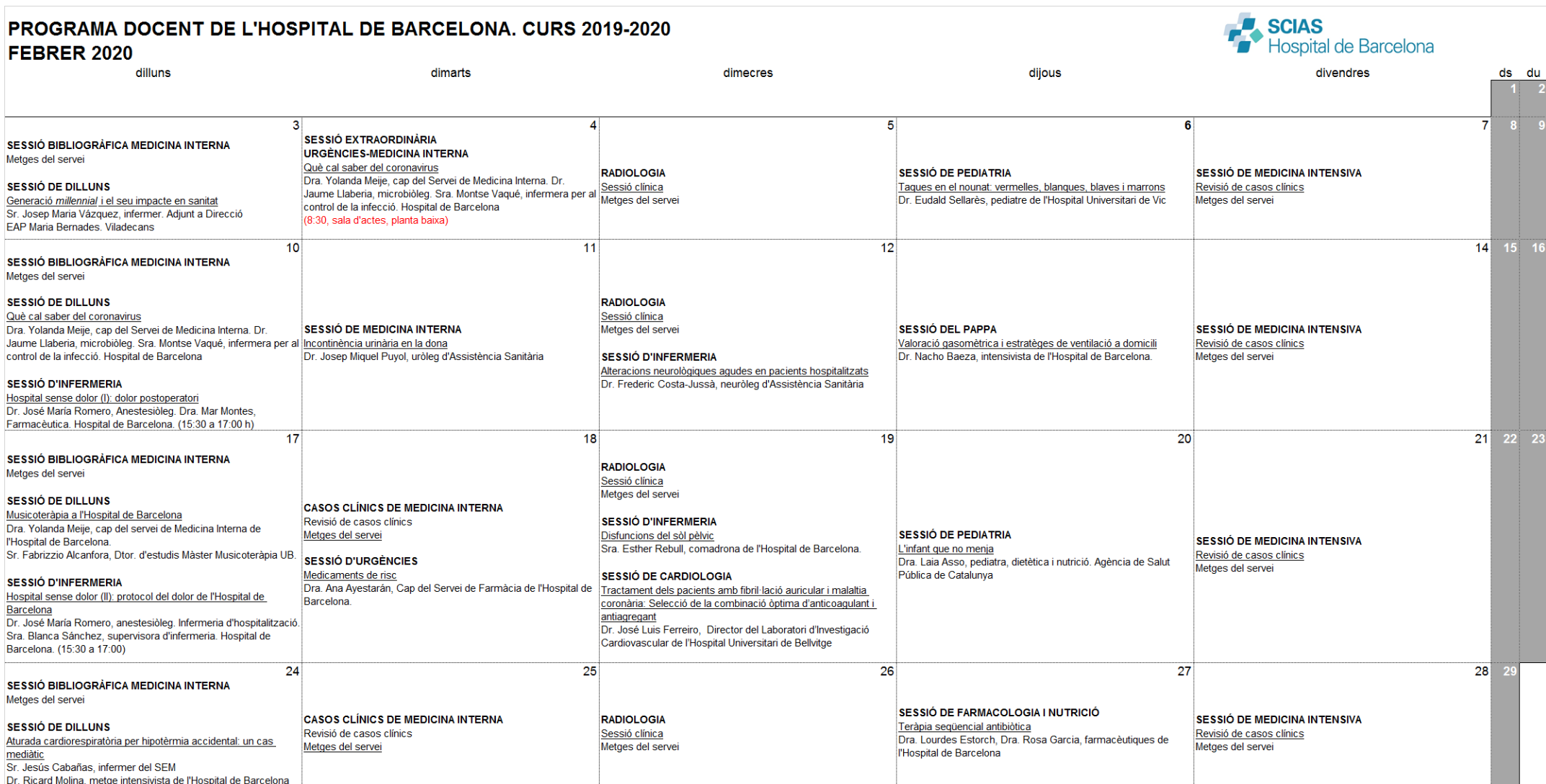
Figura 4. Exemple del Programa Docent de l'Hospital de Barcelona