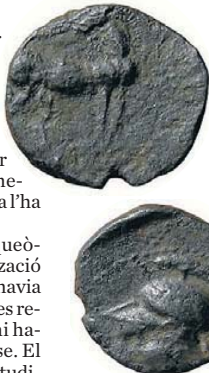
Algunes monedes cartagineses. UNIVERSITAT DE BARCELONA

Feia molts anys que els arqueòlegs buscaven Kissa. La localització era tot un enigma i, fins i tot, hi havia la teoria que Polibi, en realitat, es referia a l'actual Tarragona, on hi havia l'assentament iber de Kesse. El 2013, en una prospecció amb estudiants de pràctiques de la Universitat de Barcelona (UB) a Valls, es van trobar les restes d'un fossar. Des d'aleshores s'han buscat més pistes.