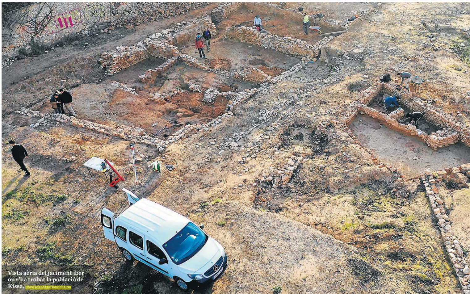
Vista aèria del jaciment ibèr on s'ha trobat la població de Kissa. UNIVERSITAT DE BARCELONA