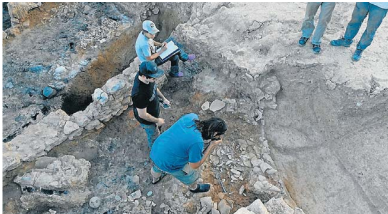
El jaciment iber del Vilar. UNIVERSITAT DE BARCELONA

ilercavons i ositans. Eren els pobles ibers que controlaven el curs inferior del riu Ebre i no van dificultar el pas de les tropes cartagineses. De fet, es van convertir en aliats dels cartaginesos des dels primers compassos de la guerra. Segurament, Annibal va emprendre intensos contactes diplomàtics previs a la marxa cap a la península Itàlica, de la mateixa manera que va fer amb els pobles del sud de la Gàl·lia. En canvi, la majoria dels poblats ibers de la costa, com el cas dels cossetans, eren més afins als romans. Per això, segurament, Kissa va ser destruïda pels cartaginesos.